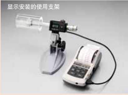
显示安装的使用支架