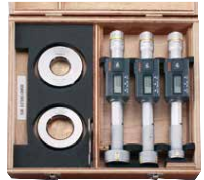
不可更换的测头套装 * 详细信息参见 C-6页。