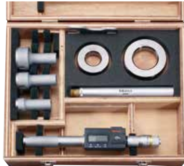
可更换的测头套装 (可更换测头类型) * 详细信息参见 C-5页。

* 不使用提供的标配测头，而去使用其它测头；或者使用其它套装的副测头增加测量范围都是不可取的。（不能保证测量精度的准确性）。